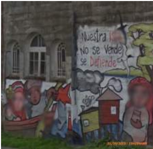
rue Eleuterio Ramírez

En vous retournant, vous voyiez le musée des pompiers.