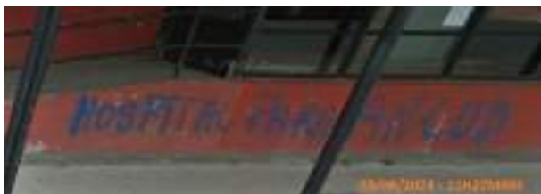
rue Blanco Encalada