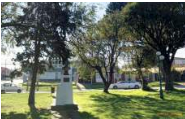
rue General. Baquedano