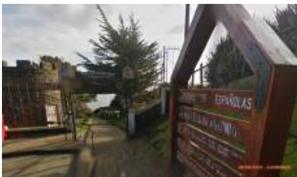
rue San Antonio

Pour trouver plus facilement les spots des photos, il était noté dessus les heures de prises de vue. Comme c'était déjà le cas pour les 3 photos, vous saviez que je marchais à 4,17 km/h