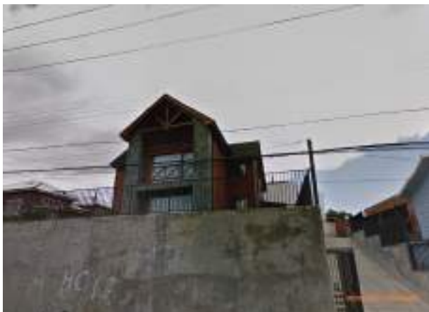
rue Libertador Bernardo O'Higgins